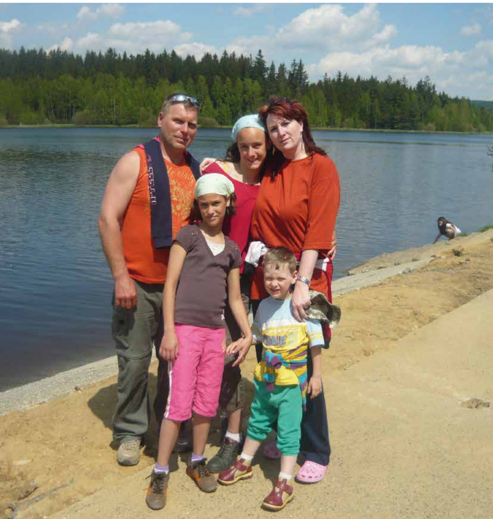
rodina Dědova: 3 děti v pěstounské péči