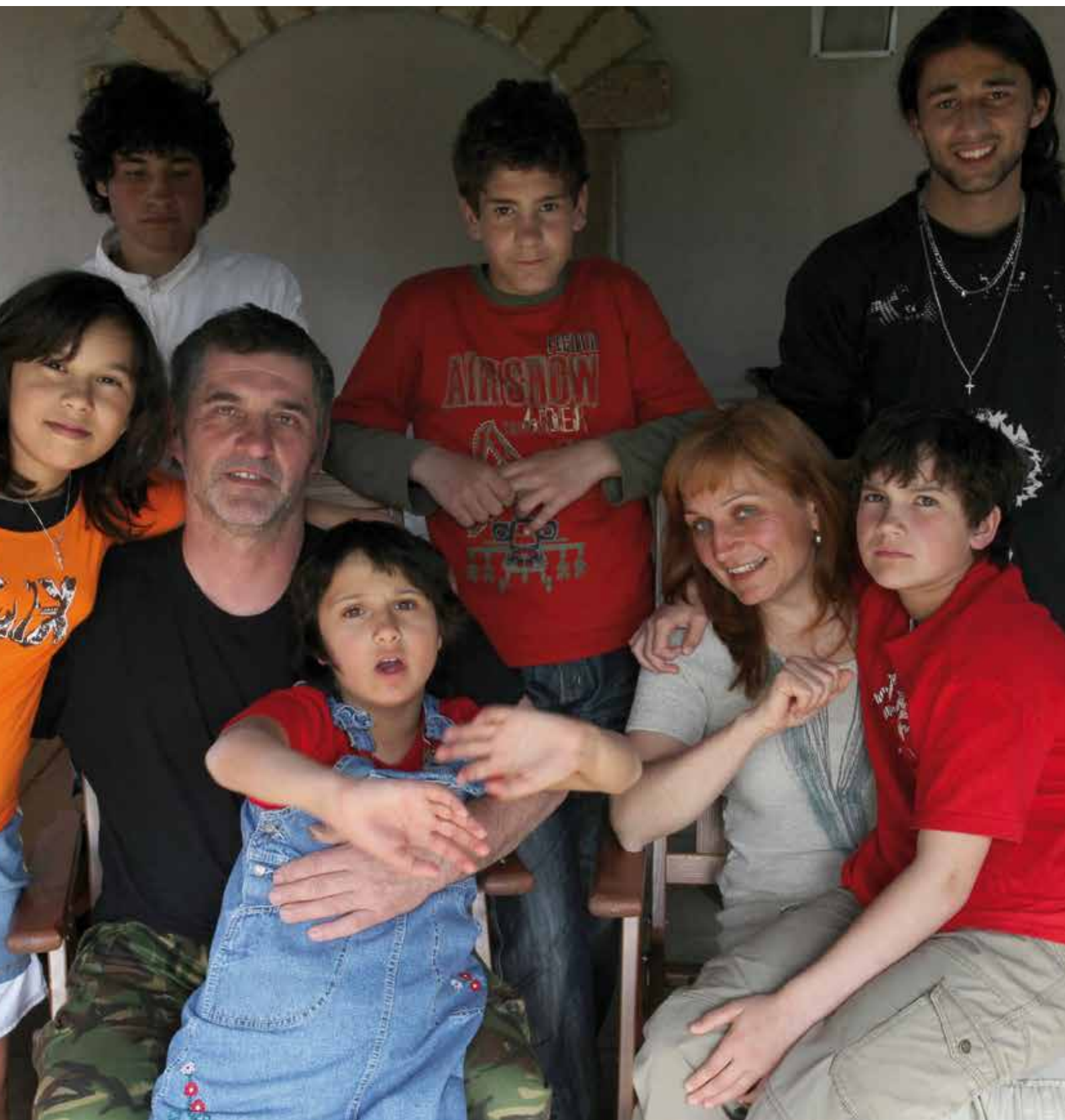
rodina Striových: 5 dětí v pěstounské péči